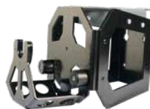
Set porta soportes para fijación en pared con soporte para garras adicionales