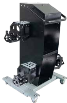
Carro multiuso porta soportes y garras adicionales