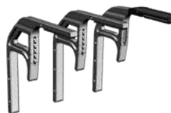
Set de extensiones para uso con furgonetas