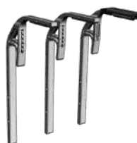
Set de extensiones XL para diámetros rueda de 32" a 39"