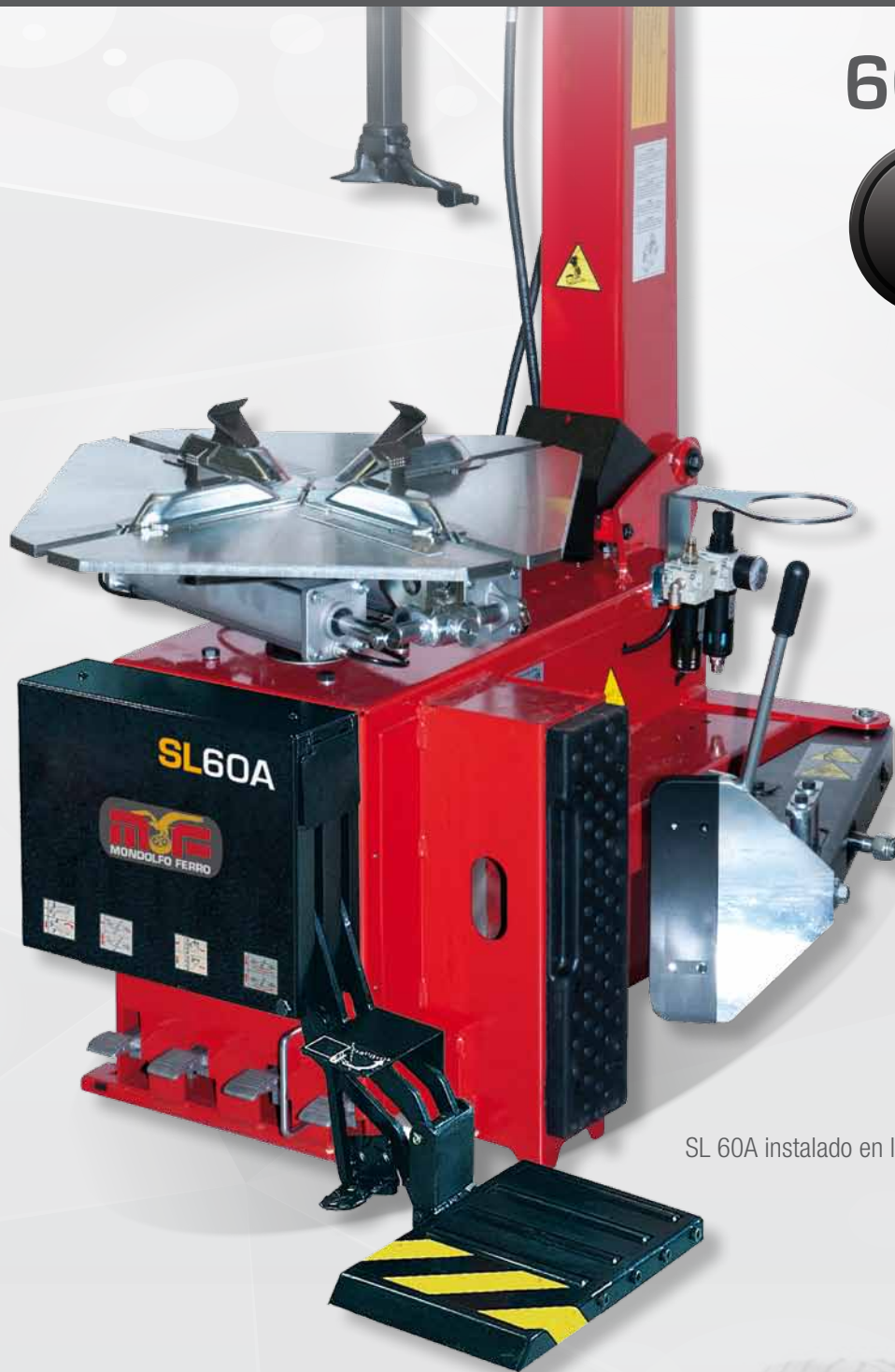
SL 60A instalado en las AS 924